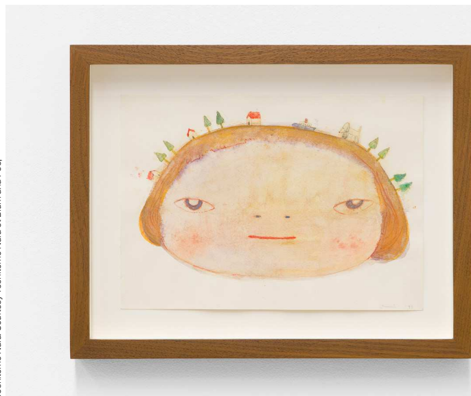
Yoshitomo Nara

Les transactions, réalisées pour la plupart auprès de collectionneurs asiatiques et américains, ont globalement été au rendez-vous : la galerie Blum & Poe (Los Angeles, New York, Tokyo) annonçait cinq ventes dès la preview , dont plusieurs Yoshitomo Nara (entre 150 00 et 275 000 euros) ; tandis qu'Hauser & Wirth cédait des pièces de Josef Albers (600 000 dollars), Jenny Holzer (350 000 dollars) et Pipilotti Rist