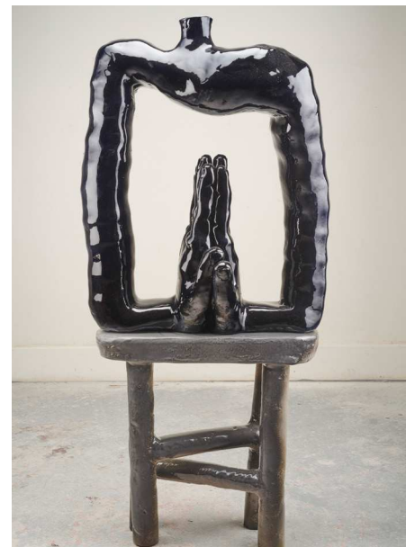
De gauche à droite : Othello, Grieving , 2020, 116,8 x 41,9 x 40,6 cm ; On the Clock , 2020 ; A Hope for a Prayer , 2020, 104,1 x 122,5 x 22,8 cm. Jessica Silverman Gallery, San Francisco. Pour l'ensemble des pièces : vendues entre 10 000 et 25 000 dollars à une collection californienne.