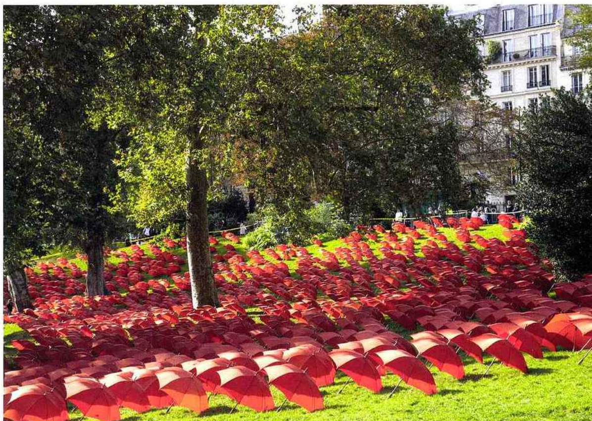
Vue de l'installation de Noël Dolla Deux-cent vingt ans de rêves pour l'exposition Chazab - les matras au Parc des Buttes-Chaumont, Paris, 2009.

ces récentes pièces délicates, qui allient compositions rigoureuses et emploi du hasard, on songe aussi à la syntaxe de Martin Barré, à des schémas qui marient méthodiquement grilles, rabats, plis. Signification de l'œuvre qui renvoie à son processus même de réalisation. Quand on interroge plus précisément l'artiste niçois sur sa pratique, c'est souvent l'engagement politique qui fait surface. Noël Dolla développe : « J'ai souvent dit qu'un artiste important est celui qui est capable de déplacer des croyances et des consciences en art comme en politique. Je voudrais que mon œuvre trouble, inquiète ou fascine. Dans ma pratique, il y a toujours quelque chose de familier, de populaire, de joyeusement triste, mais toujours loin de la poussière du Surréalisme. Torchons, serpillères, mouchoirs, draps de lit, taies d'oreillers, gants de toilette, tarlatanes, plumes de coq, tabliers... permettent de se faire heurter deux mondes, celui du signe reçu, peinture ou teinture, tache ou points, et l'ensemble des connotations fantasmagiques propre par exemple à un drap de lit : amour, sexe, maladie, mort. »