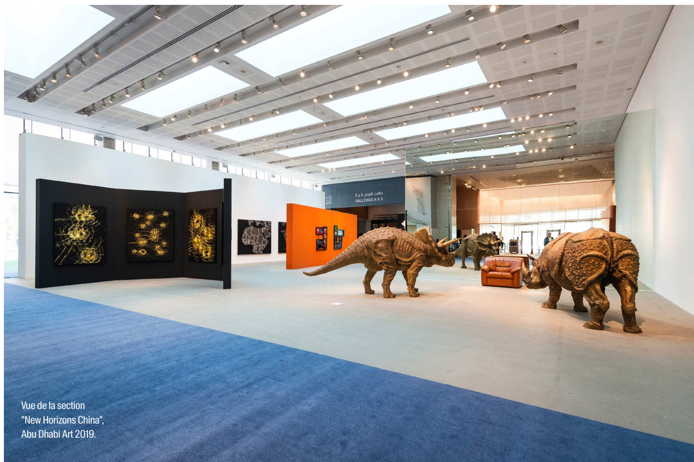
Vue de la section "New Horizons China", Abu Dhabi Art 2019.