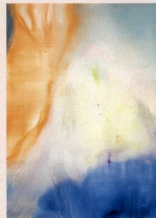
Aneta Kajzer Melusina 2022, huile sur toile, 160 x 120 cm. Semiose, Paris (section «Solo»).

Art Brussels du 20 au 23 avril • Brussels Expo place de la Belgique 1 • 1020 Bruxelles • artbrussels.com