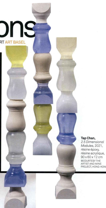
Tap Chan, 2.5 Dimensional Modules , 2021, résine époxy, résine acrylique, 90 x 60 x 12 cm ©COURTESY THE ARTIST AND MINE PROJECT, HONG-KONG.

désormais libres de leurs mouvements, devraient revenir en nombre. Du côté des galeristes, chacun se réjouit de cette nouvelle édition, à l'exemple d'Andréhn-Schiptjenko : « Cela va être notre 25 e année à la foire, qui reste un moment majeur dans le calendrier de la galerie pour les ventes bien sûr, mais aussi pour les échanges avec les collectionneurs, les curateurs et les collègues, ainsi que pour les découvertes artistiques et les expositions institutionnelles ». Du côté de l'art moderne, Franck Prazan avait mis à profit les précédents ralentissements d'activité pour « sourcer » des chefs-d'œuvre qu'il ne dévoilera qu'à Bâle, à commencer par l'une des toiles les plus importantes de Karel Appel. L'entité Art Basel va désormais organiser Paris +, la foire d'art moderne et contemporain du mois d'octobre qui prend la place de la Fiac au Grand Palais éphémère, sous la direction de Clément Delépine. Si critiques ou craintes ont pu fuser au départ, l'organisation suisse sans faille et l'assise financière du groupe augurent de belles perspectives pour l'Hexagone. M. M.