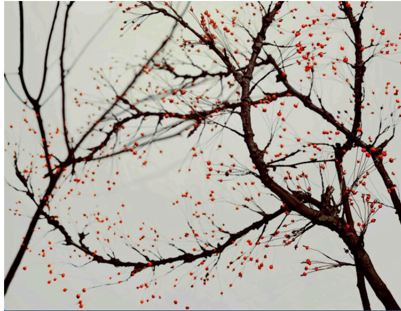
Sonja Braas, The Other Day 1 , 2021, Pigment Print framed, 140 x 105 cm, The artist courtesy Galerie Tanit. TANIT.