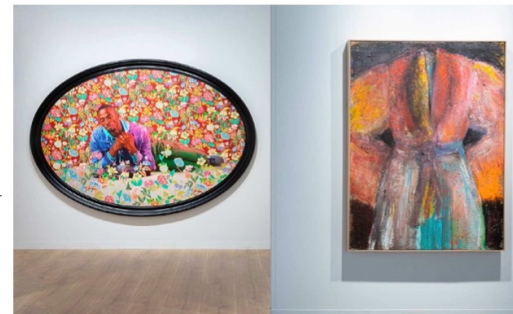
Vue du stand de la galerie Templon. De gauche à droite : Kehinde Wiley, Christian Martyr Tarcisive (Et Hadij Malick Guéye) (2022), Jim Dine The Winter solstice (2021).