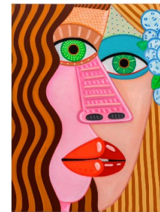
Brian Calvin, Guardians, 2022, acrylique sur toile, 137,2 x 101,6 cm. Galerie Almine Rech.