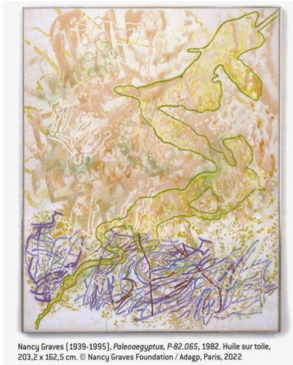
Nancy Graves (1939-1995), Paleoegyptus, P-82.065, 1982. Huile sur toile, 203,2 x 162,5 cm.