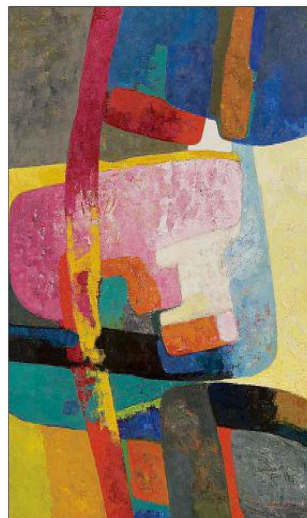
MONTAVENT. Maurice Estève, 1963. Présentée au Fab Paris. GALERIE DAVID LÉVY