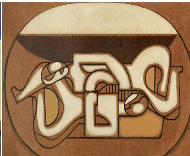
COUPLE À L'OVALE (DÉTAIL). Maurice Estève, huile sur toile, 1930. Présentée au Fab Paris 2023. GALERIE APRICAT-PRAZAN