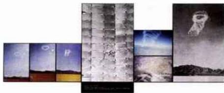
Dennis Oppenheim, Whirlpool - Eye of the Storm, 1973, photographies, 220 x 500 cm.