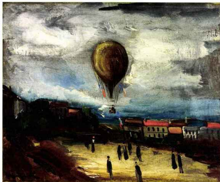
Maurice de Vlaminck, Enlèvement d'un ballon à Pontoise , 1923, huile sur toile, 38 x 46,5 cm Expertise Wildenstein, Vente le 3 déc.