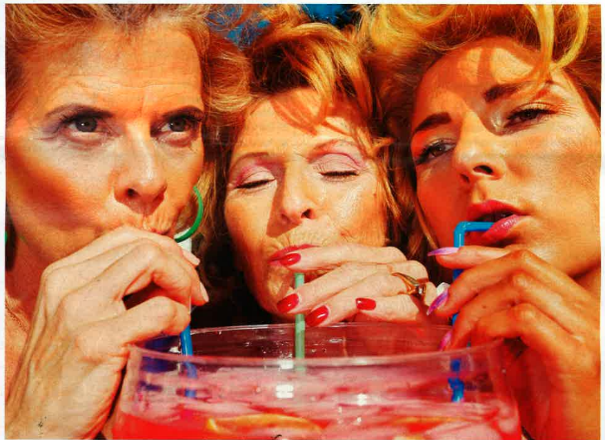
Kourtney Roy, The Tourist , 2020.

Après le succès relatif des foires Art Paris, Art Basel et de la Fiac compte tenu du contexte sanitaire toujours instable, le salon parisien consacré à la photographie espère susciter le même enthousiasme. Bien que plus limitée, l'offre apparaît de qualité tant au Grand Palais éphémère qu'ailleurs dans la capitale.