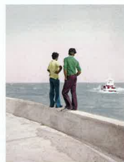
Vasantha Yoganathan, An Ocean of Uncertainty , Kanyakumari, Tamil Nadu, Inde, 2013, C-print noir et blanc peint à la main par Jaykumar Shankar, 34 x 42 cm.

APPROCHE , du 12 au 14 novembre, Le Molière, 40, rue de Richelieu, 75001 Paris.