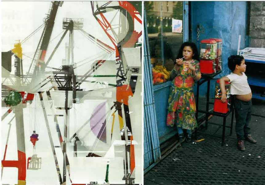
De gauche à droite : Stéphane Couturier, Série « Les nouveaux Constructeurs » Sète - Port de Commerce n° 1, 2018, C-Print, 130 x 98 cm. Helen Levitt, N.Y. , 1971, 50 x 42 cm.