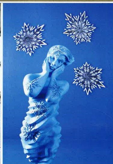
De gauche à droite : Gosette Lubondo, Imaginary Trip #10, 2016 , impression numérique sur papier Baryta, 54 x 80 cm. © G. Lubondo/ Galerie Angalia. Sandy Skoglund, Winter Sketch #1, 2019 , 27 x 40 cm. © S. Skoglund/ Galerie Pact.