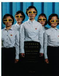
Stéphane Gladieu, Corée du Nord , 2020, livre, 18x23 cm.