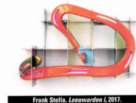
Frank Stella. Leeuwarden I, 2017.

■ Galerie Ceysson & Bénétière, 23, rue du Renard, 4 e . Jusqu'au 24 juin. www.ceyssonbenetiere.com