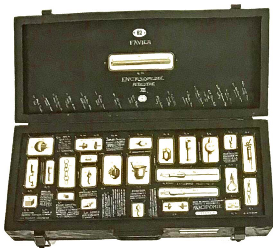
Encyclopédie pédestre, 2016-2017