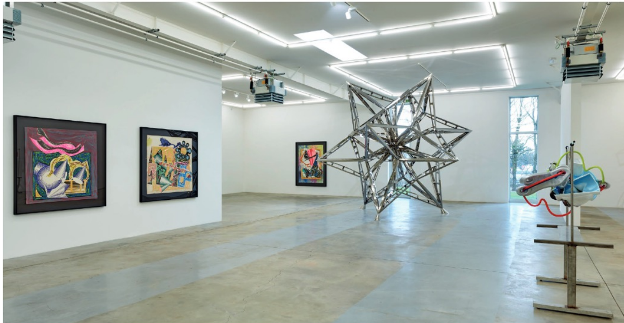
Vue de l'exposition « Frank Stella, Salmon Rivers of the Maritime Provinces », Galerie Ceysson & Bénétière, Luxembourg.