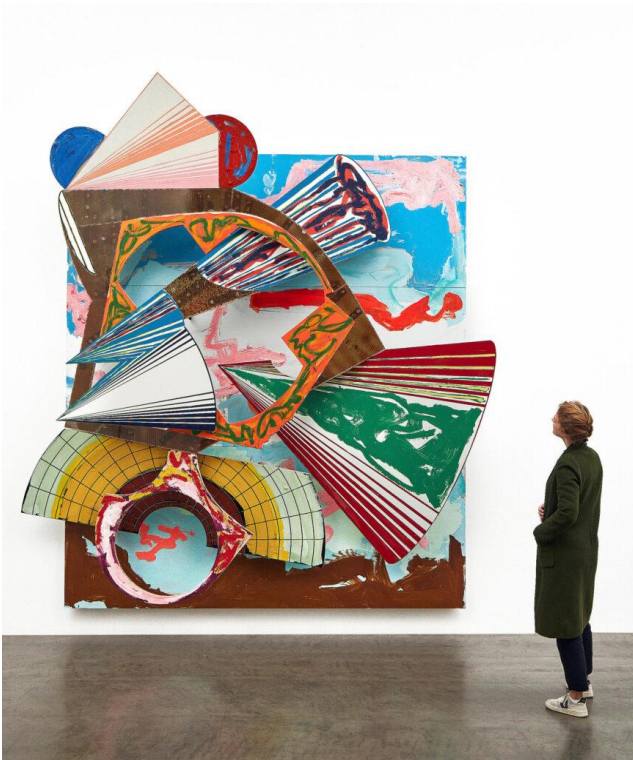
Frank Stella (1936-2024), La prima spada e l'ultima scopa

mettent en évidence une cacophonie de reliefs enchevêtrés. Suspendues à des socles sur roulettes, certaines d'entre elles sont des oeuvres-trophées qui évoquent un réseau de flux, la circulation des fluides, semblable au mouvement des volutes de fumée représentées en 3D, présentes dans la série Fluid Motion .